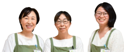
はぐはぐひろば沼南のスタッフ

ひろば内には相談室もあり、子どもを遊ばせながら専門の子育て支援アドバイザーに相談もできます。妊婦さんも大歓迎です