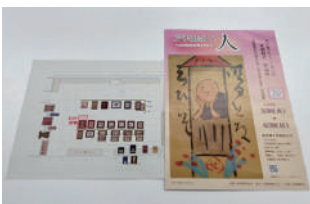
お手製のチラシと室内のレイアウト図

沼南庁舎の2階にある郷土資料展示室では、市が所蔵する美術作品の展覧会が定期的に開催されています。展覧会の準備は、企画内容を考えることから始まり作品選定を行います。併せてPRのためのチラシ制作、著作権の承認申請、展示室内におけるレイアウト図の作成なども必要になります。さらに、作品保護のために温度・湿度・照度を一定に保つことも重要なようです。美術に関心が薄いかたにも楽しんでもらえるように、毎回工夫を凝らしているようで、今回のおすすめは室内の一角に設置した解説動画の視聴コーナーです。