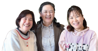
地域子育て支援センターの保育士

大人気の運動の時間では、月に2回、先生がレクチャーを交じえて器械運動などを教えてくれるので、普段できない運動を体験できます。