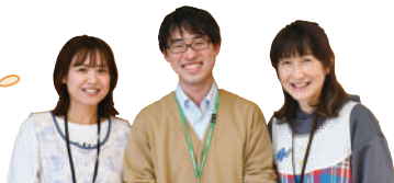
児童センターのスタッフ

しこだ児童センターには、卓球台やバスケットゴールがあり、いつでも自由に遊べるので、ぜひ遊びに来てください！