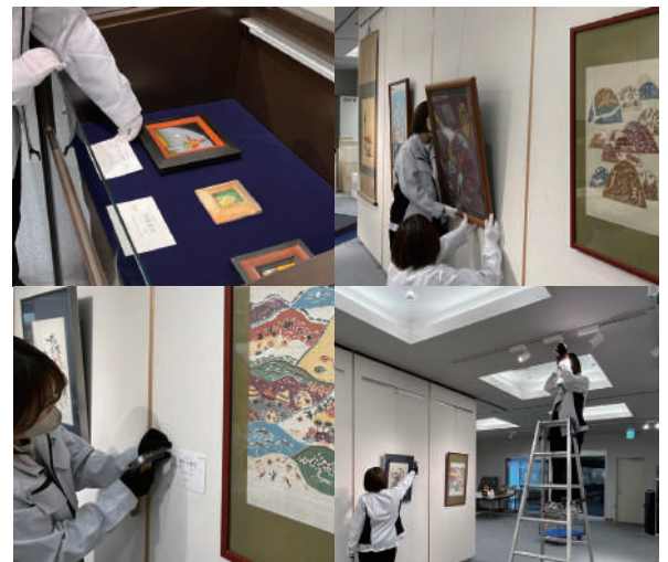
トンカチ使いもお手のもの

また、作品を紹介する「キャプション」を固定するために、トンカチで小さいピンを打っていく作業もなかなか繊細。真っすぐ打つにはコツがあるようで、試しに一本打たせてもらいましたが、ピンが大きく曲がってしまい大失敗でした。